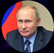
Владимир Владимирович Путин Президент Российской Федерации

«Компьютерные игры должны помогать человеку развиваться, воспитывать в людях общечеловеческие ценности».