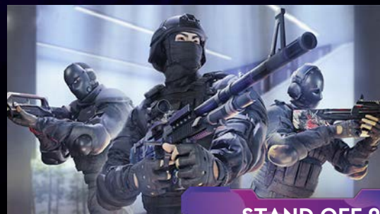
STAND OFF 2