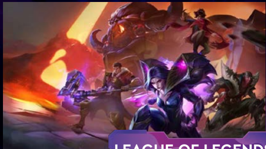
LEAGUE OF LEGENDS