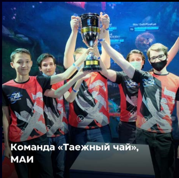
Команда «Тажный чай», МАИ

«Такого эспириенса не было давно! Было круто, спасибо организаторам за такую атмосферу, и соперникам за крутейшие моменты в играх!»