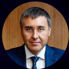
Валерий Николаевич Фальков Министр науки и высшего образования Российской Федерации

«Порядка 15 миллионов россиян интересуются киберспортом, почти 60% жителей страны старше 16 лет тратят на игры больше трех часов в неделю».