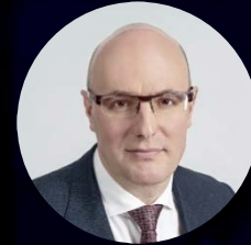
Дмитрий Николаевич Чернышенко Заместитель Председателя Правительства Российской Федерации

«Компьютерные игры должны помогать человеку развиваться, воспитывать в людях общечеловеческие ценности».